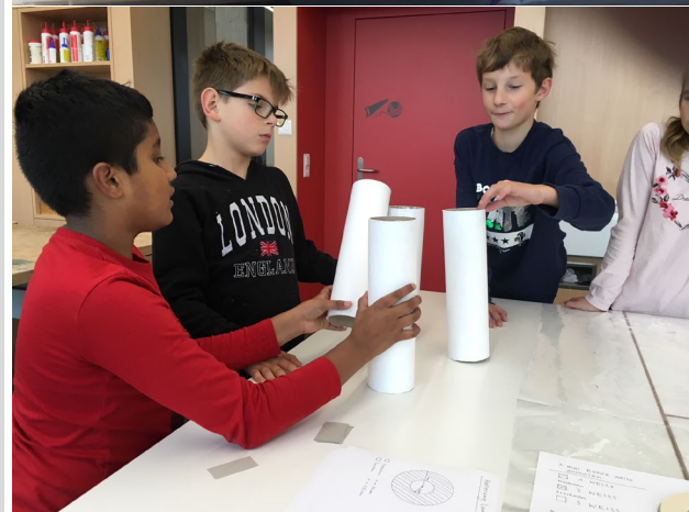
Alle sind weiss. Aber wer weiss was das beste Weiss ist?